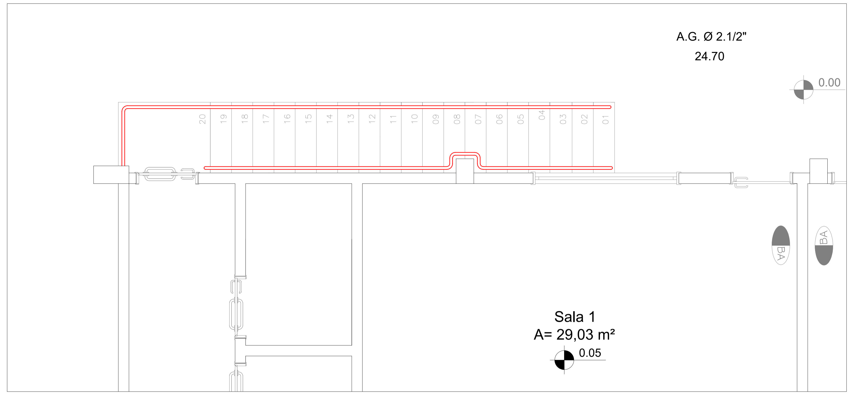
PLANTA BAIXA ESCADA GINÁSIO ESCALA: 1/20